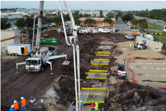
Foundation formwork for a supermarket canopy