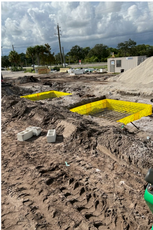
Foundation formwork for a supermarket canopy