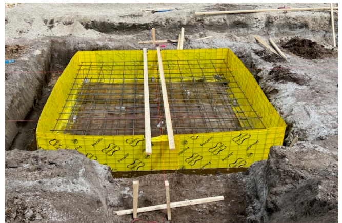
Foundation formwork for a supermarket canopy