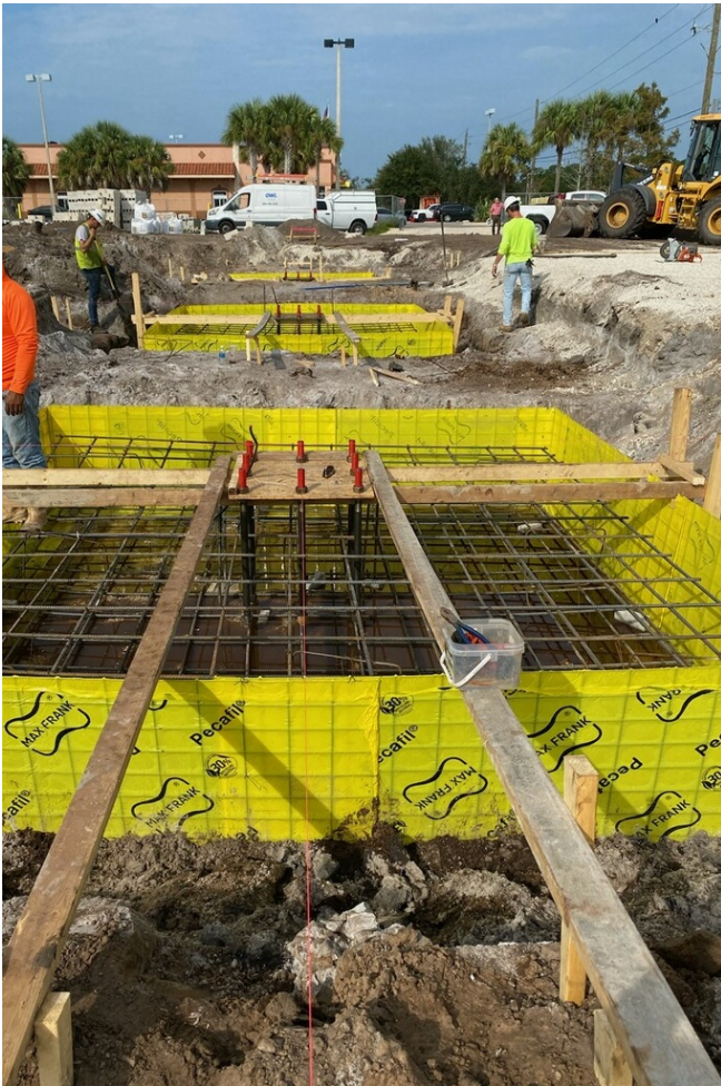
Foundation formwork for a supermarket canopy