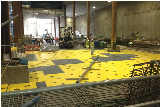
Pecavoid® installation at Heathrow T2B