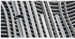
Separadores lineales de hormigón reforzado con fibras