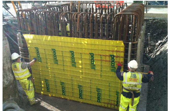
Pecafil® installation at Heathrow T2B