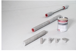
Entretoises en béton fibreux (tubes fibro)