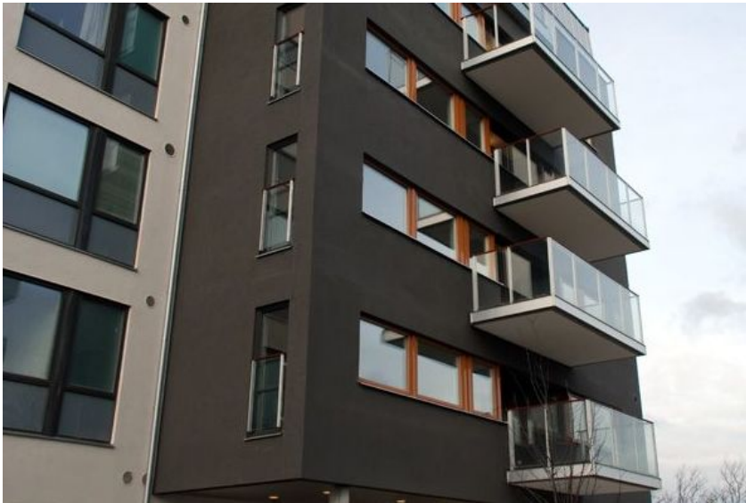
Victoria Park Malmö

Die Wohnviertel Victoria Park besteht aus insgesamt 133 Wohnungen und liegt im Stadtteil Limhamn von Malmö.