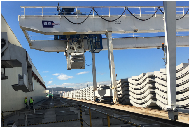
Transport of segments in the plant