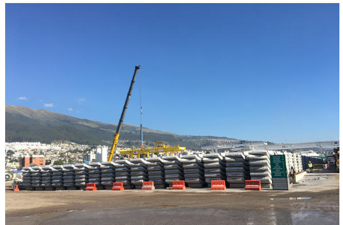
Stacked tubings in the outdoor area