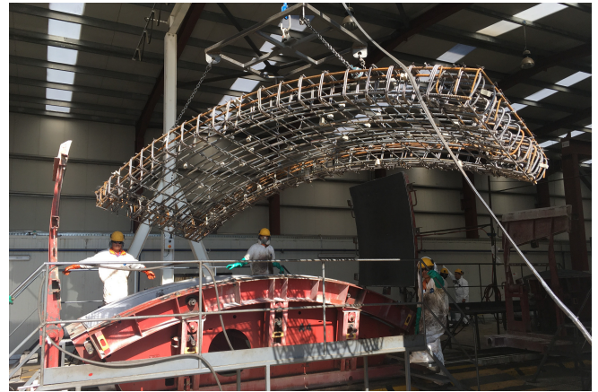
Introduction of reinforcement with fixed spacers into the vibrating formwork