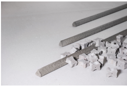
Afstandhouders van vezelbeton